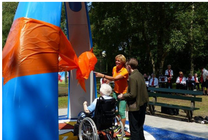
Foto: opening boog Randerode

Aanvankelijk was de looptijd van het Sona-project van juli '13 t/m juli '15. Omdat wij graag nog een extra zomerperiode wilden meepakken, hebben we de subsidieverstrekkers Fonds NutsOhra en Fonds Sluyterman van Loo om een verlenging gevraagd. Zijn zij hiermee akkoord gegaan en nu loopt het project tot oktober 2015 ! We hebben dus nog een extra zomer om het gebruik van de Sonaboog met z'n allen tot een (nog groter) succes te maken!