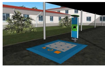
Een beeldscherm met daarvoor tegels met beweegsensoren erin