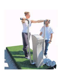
Standing Strong buitenfitness

Samen met diverse partijen alsmede met samenwerkingspartner Yalp bereidt DAZ momenteel meerdere grotere en kleinere projecten voor rond het thema 'spelenderwijs' bewegen, zowel in de wijk als bij zorginstellingen. Wilt u ook een project in uw regio of bij uw instelling, neem contact op met DAZ.