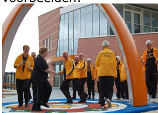
Een geluidsboog met muziek en diverse spellen

Een volgende generatie speel- en beweegtoestellen dient zich aan, ook voor deze doelgroepen. Enkele voorbeelden: