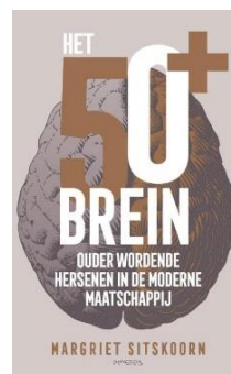
De schijf van vijf voor vitaal verouderen